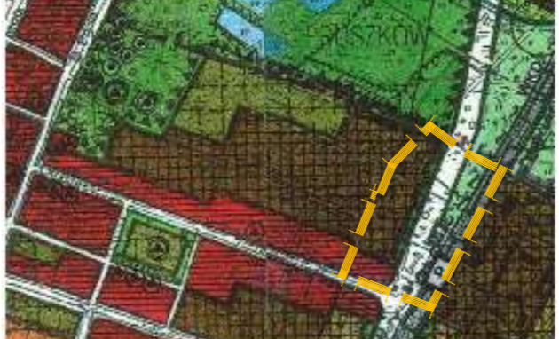
WYRYS ZE STUDIUM UWARUNKOWAŃ I KIERUNKÓW ZAGOSPODAROWANIA PRZESTRZENNEGO MIASTA PRUSZKOWA PRZYJĘTEGO UCHWAŁĄ NR XXVIII/309/2000 RADY MIEJSKIEJ W PRUSZKOWIE Z DNIA 16 LISTOPADA 2000 R. WYRYS W SKALI 1:10000 - ZMNIJSZENIE ZE SKALI 1:5000