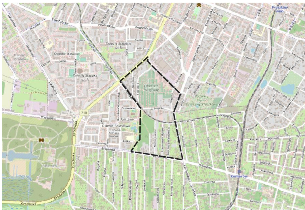
Ryc. 1. Lokalizacja terenu opracowania na tle fragmentu miasta Pruszków (Open Street Map)

Obszar objęty opracowaniem obejmuje fragment miasta Pruszkowa, usytuowany w południowo-zachodniej części miasta. Od wschodu i południa ograniczony jest przebiegiem granic administracyjnych miasta Pruszkowa, pokrywającymi się z przebiegiem fragmentu ulic Komorowskiej i Brzozowej. Granica zachodnia przebiega przez pas rezerwy terenu pod planowaną kiedyś trasę Ksiąząt Mazowieckich tereny zieleni urządzonej (Park Źwirowisko) oraz częściowo wzdłuż torów kolejowych łącznicy WKD-PKP. Północną granicę wyznaczają ulice Gordziałkowskiego oraz Wojska Polskiego.