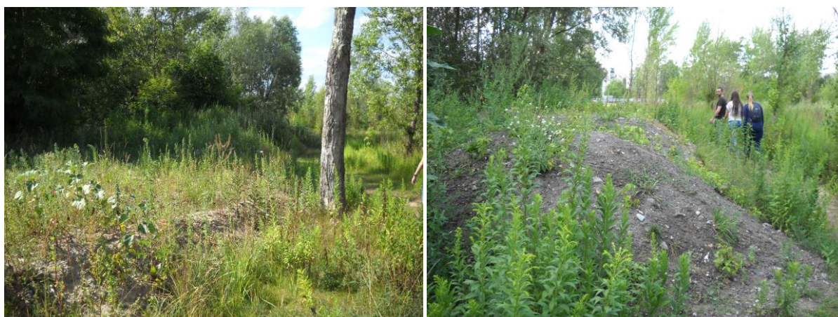
Ryc. 3. Zbiorowiska roślinności synantropijnej