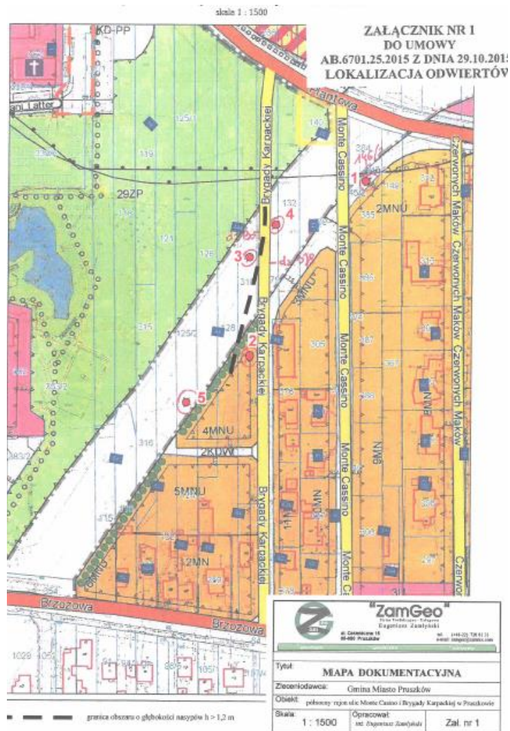
Ryc. 2. Lokalizacja wierceń