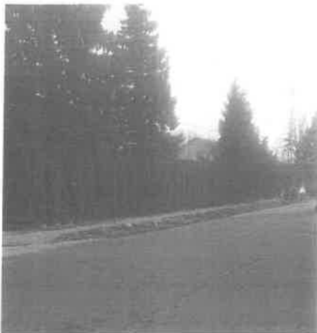
Zdjęcie 8. Brak znaku nakazu skrętu w prawo na łącznik ul. Skłodowskiej z ul. Moniuszki. Znak zakaz zatrzymywania – bez możliwości zastosowania przy obecnej organizacji ruchu