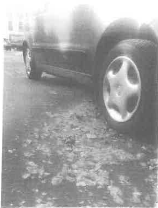
Zdjęcie 5. Samochód, który podwoziem ociera się o grunt po wjechaniu w zagłębienie ok.30 cm w drodze