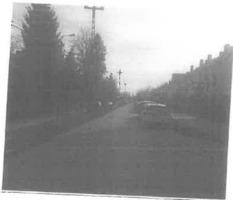
Zdjęcie 6. Brak przejeźdności ul. Marii Skłodowskiej Curie po zmianie organizacji ruchu na drogę dwukierunkową. Brak możliwości minięcia się dwóch samochodów.