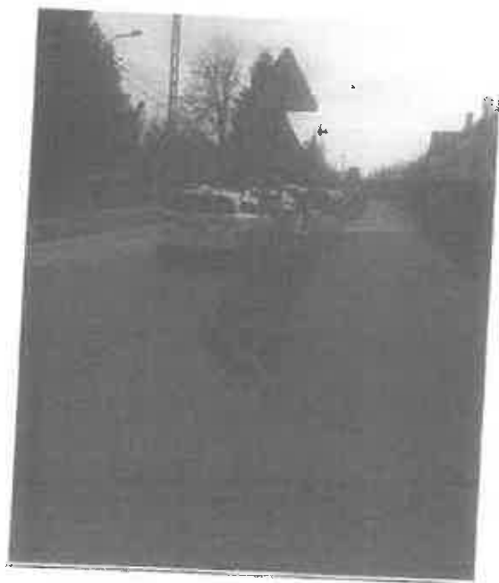
Zdjęcie 7. Brak znaku świadczącego o drodze bez wyjazdu.