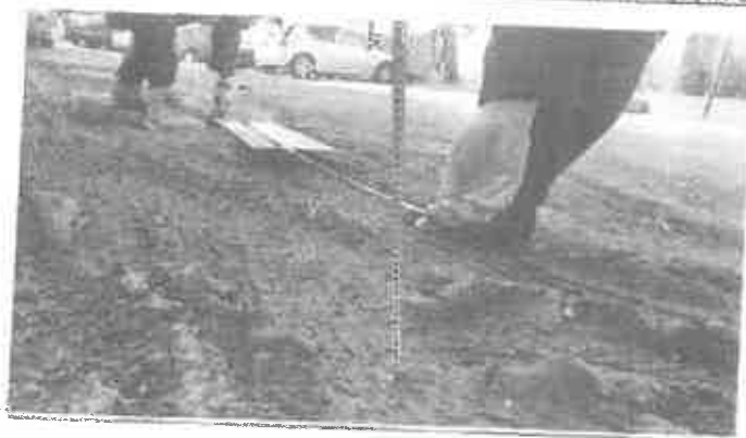
Zdjęcie 3. Nierówności na odcinku drogi łączącym ul. Skłodowskiej z ul. Moniuszki