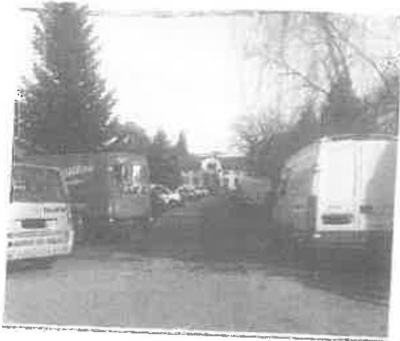
Zdjęcie 1. Odcinek drogi (łącznik ul. Skłodowskiej z ul. Moniuszki, po którym został wyznaczony objazd. Brak jakiegokolwiek organizacji ruchu na w/w odcinku