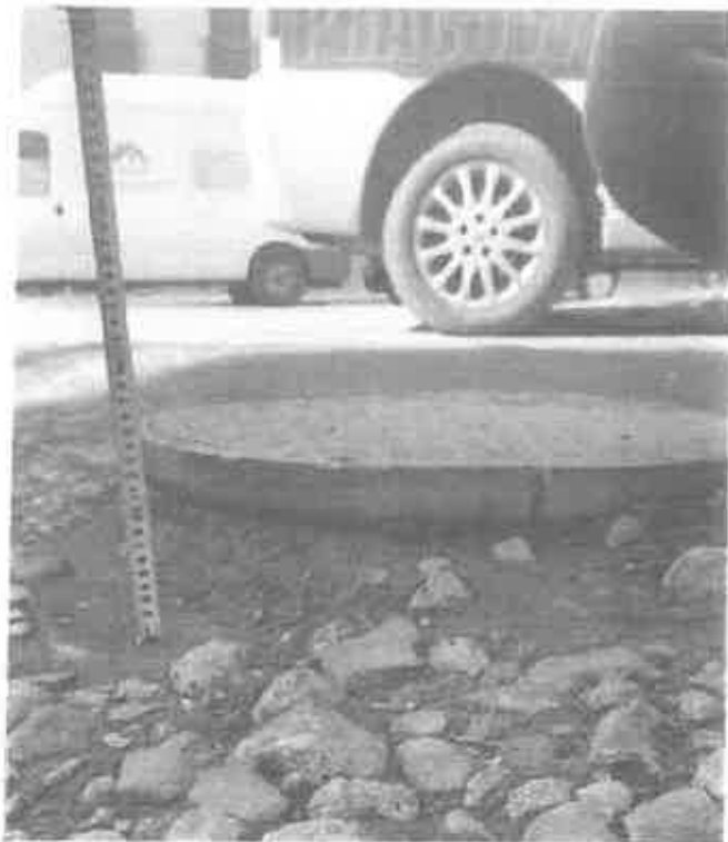
Zdjęcie 4. Właz studzienki kanalizacyjnej ok 14 cm (wyplukana nawierzchnia gruntowa z licznymi kamieniami – nieprawidłowe odwodnienie terenu)