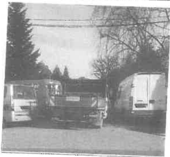
Zdjęcie 2. Brak przejezdności na odcinku drogi łączącym ul. Skłodowskiej z ul. Moniuszki