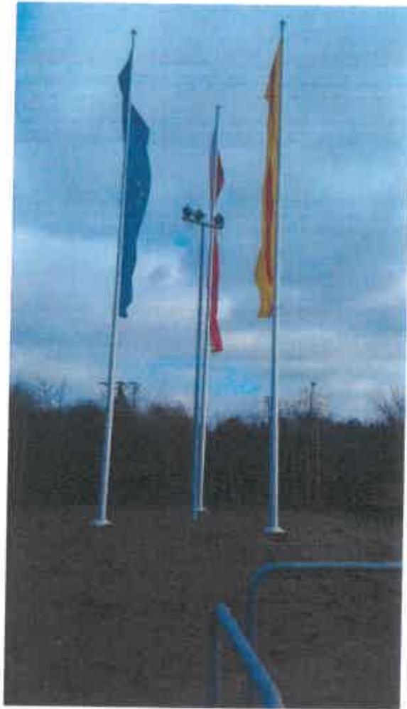
Maszty flagowe – 3 szt.