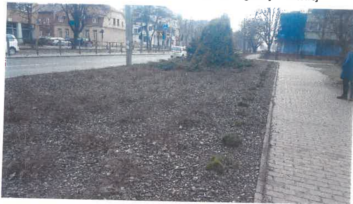
Krzewy iglaste - nasadzenia.