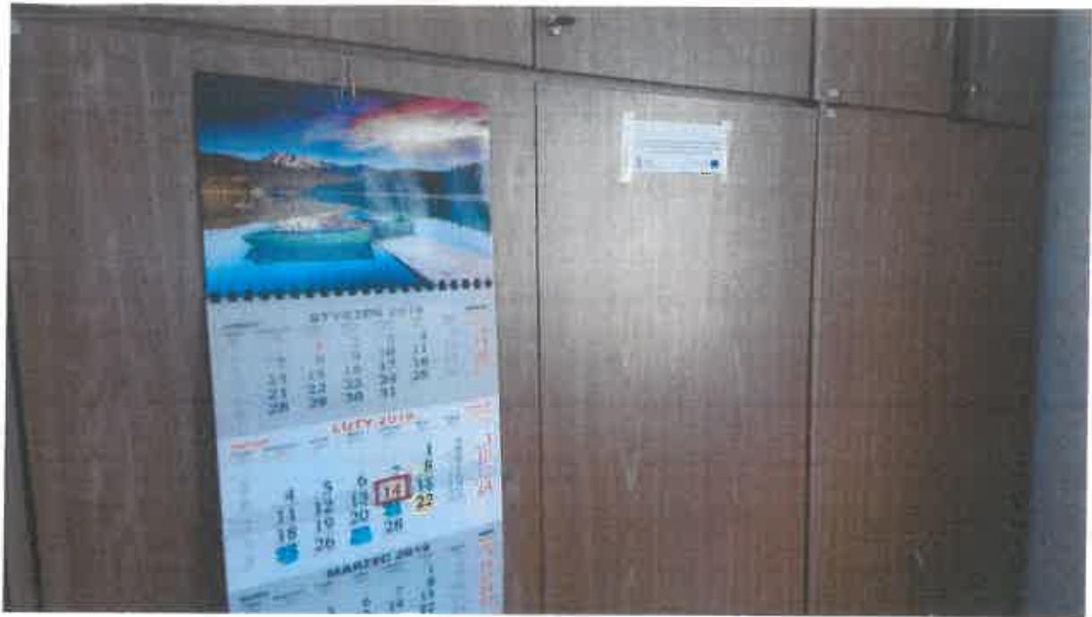
Szafa w pokoju nr 113 – Biuro Zamówień Publicznych, w której przechowywana jest dokumentacja przetargowa oraz dokumentacja związana z zamieszczeniem ogłoszenia na stronie internetowej.