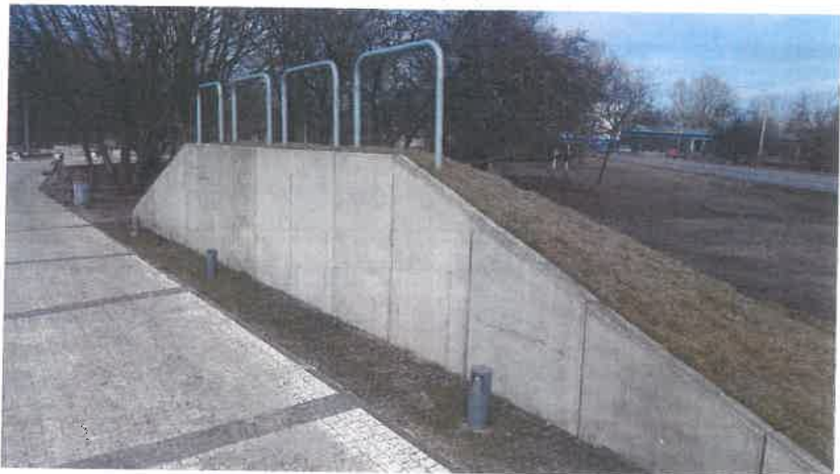
Urządzenia do ćwiczeń Parkour – 1 kpl. (zestaw kilkunastu urządzeń).