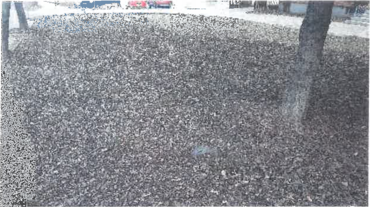
Krzewy iglaste - nasadzenia.