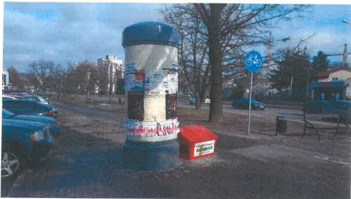
Montaż słupa ogłoszeniowego.