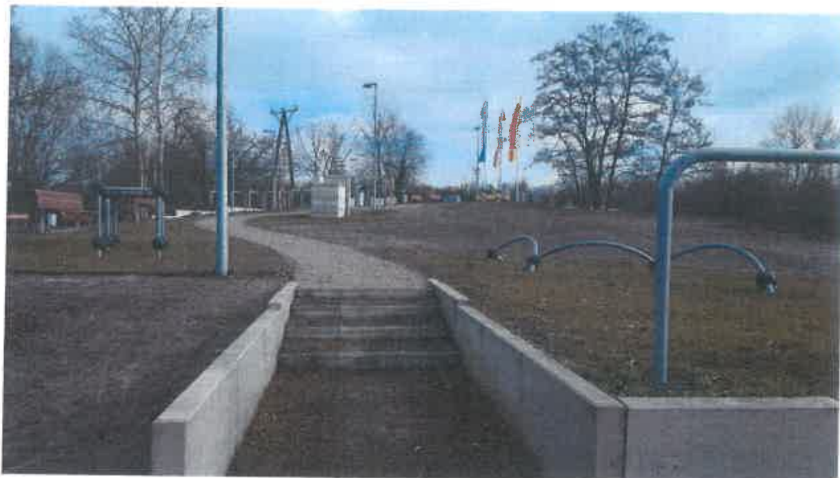
Urządzenia do ćwiczeń Parkour – 1 kpl. (zestaw kilkunastu urządzeń).