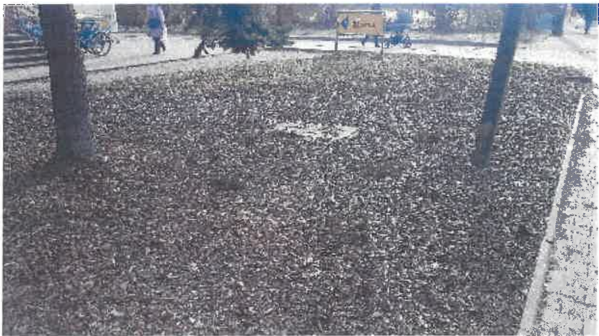
Krzewy iglaste - nasadzenia.