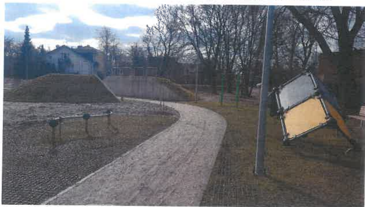
Urządzenia do ćwiczeń Parkour – 1 kpl. (zestaw kilkunastu urządzeń).

Handwritten signature or initials in blue ink.