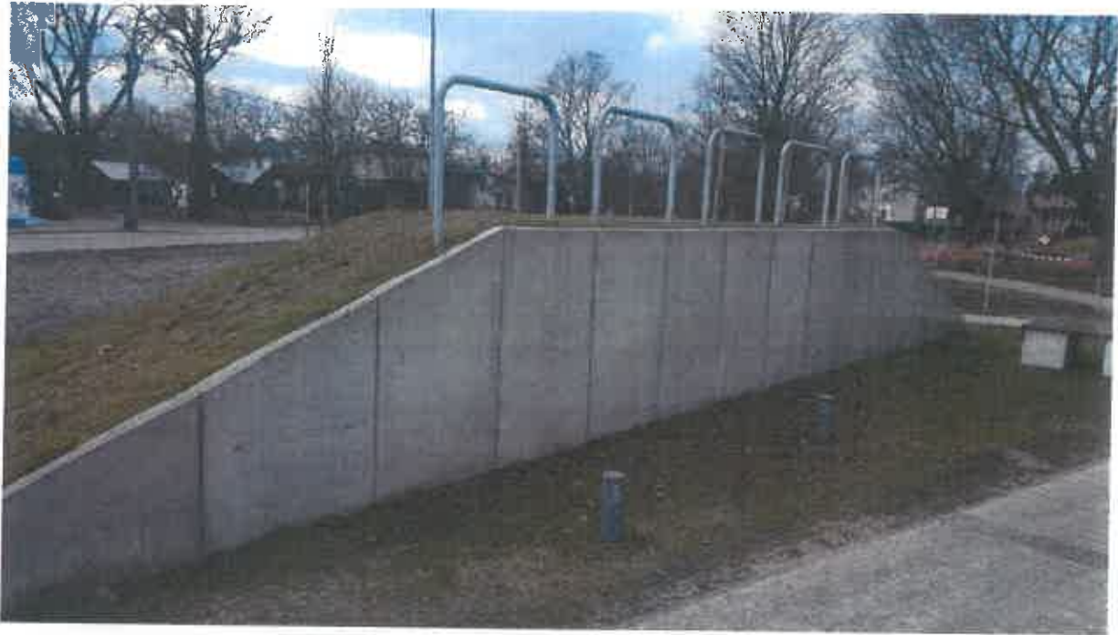
Urządzenia do ćwiczeń Parkour – 1 kpl. (zestaw kilkunastu urządzeń).