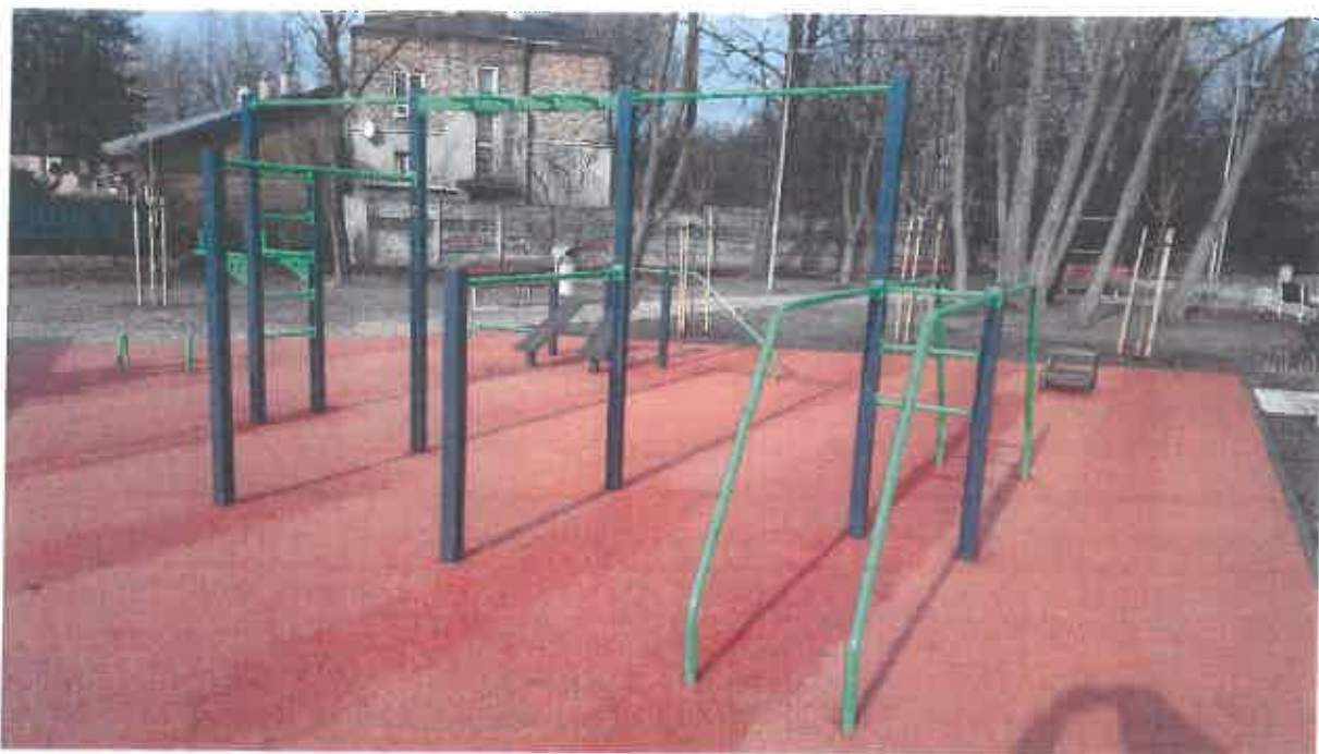
Siłownia zewnętrzna z urządzeniami Workout – 1 kpl. (zestaw kilku urządzeń).