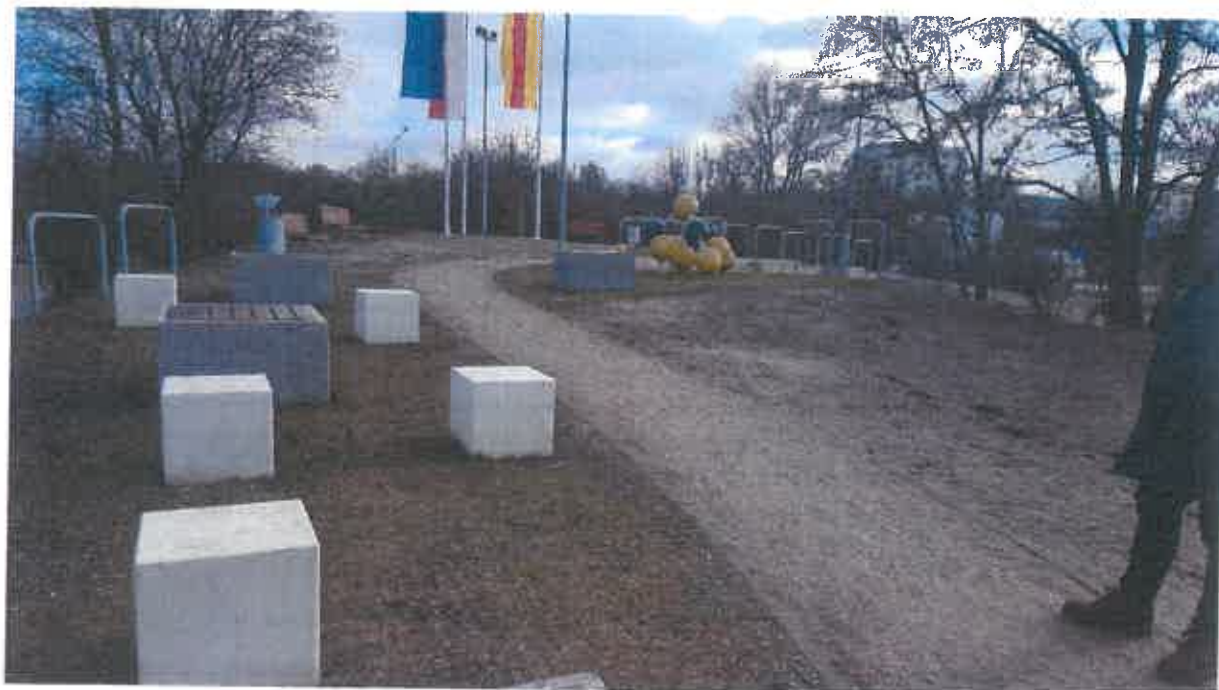
Urządzenia do ćwiczeń Parkour – 1 kpl. (zestaw kilkunastu urządzeń).