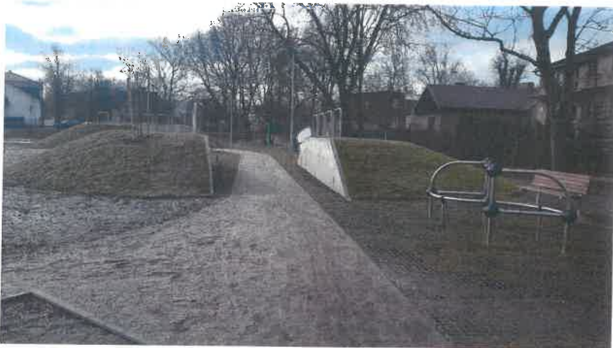
Urządzenia do ćwiczeń Parkour – 1 kpl. (zestaw kilkunastu urządzeń).