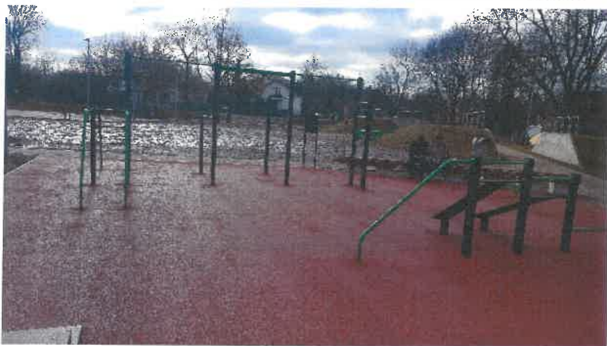
Siłownia zewnętrzna z urządzeniami Workout – 1 kpl. (zestaw kilku urządzeń).