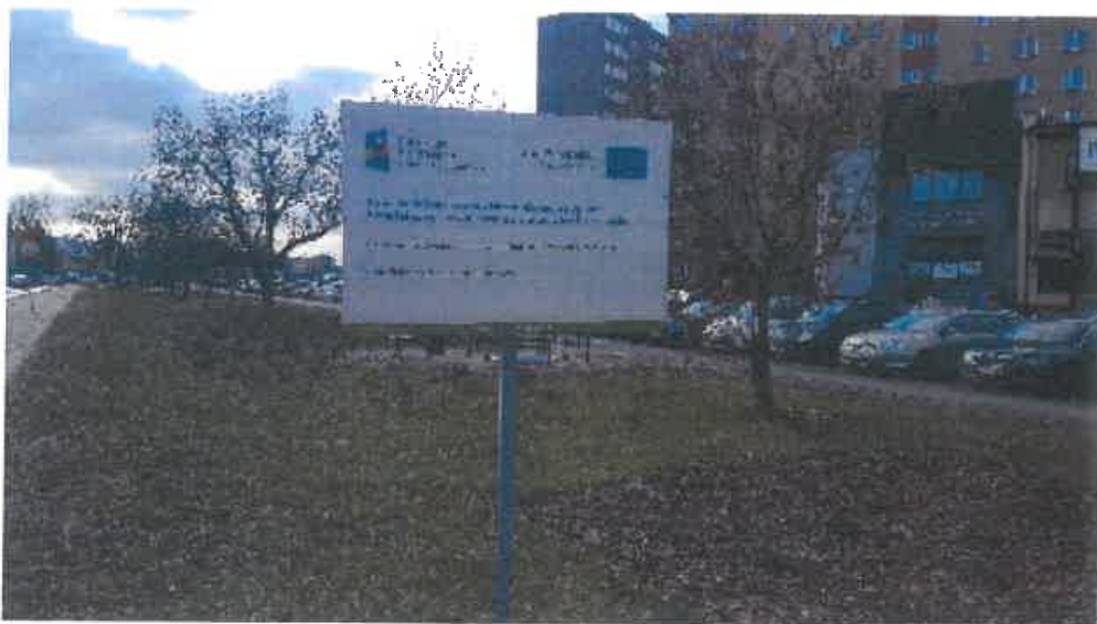
Tablica informacyjna przy Al. Wojska Polskiego przy skrzyżowaniu z ul. Powstańców (kierunek jazdy z Warszawy do Grodziska).