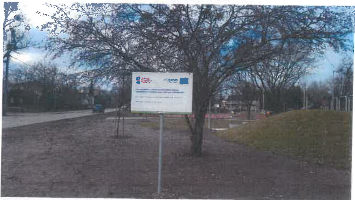
Tablica informacyjna zamontowana na terenie Anielina Zachodniego narożnik ul. Miry Zimińskiej Sygietyńskiej i Al. Wojska Polskiego.

A handwritten signature in blue ink, consisting of stylized letters and a flourish.