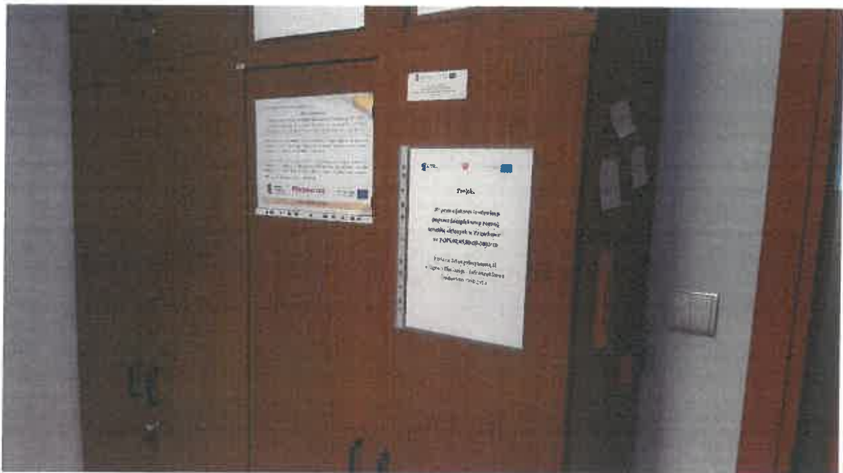
Szafa w pokoju nr 43 – Wydział Finansów i Budżetu, w której przechowywana jest dokumentacja finansowo - księgową.

NFOŚiGW Departament Kontroli Przedsięwzięć Główny Specjalista Mariusz Zega 15.02.2019 ✓