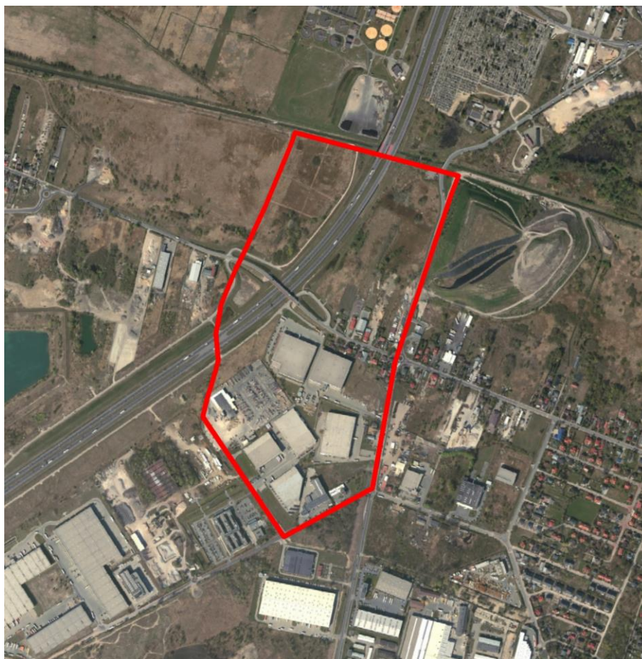
Rysunek 1. Lokalizacja obszaru objętego opracowaniem miejscowego planu zagospodarowania przestrzennego części obszaru miasta Pruszkowa – Gąsin Przemysłowy – obszar III